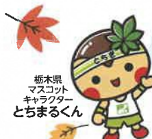
栃木県 マスコット キャラクター とちまるくん

とちまるくんと とちふくちゃんが あそびにくるよ！ ウズまごダンスを いっしょにおどろう