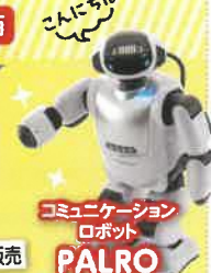
コミュニケーション ロボット PALRO

協賛 栃木トヨタ自動車株式会社、日産プリンス栃木販売株式会社、NPO法人とちぎノーマライゼーション研究会、社会福祉法人栃木県社会福祉協議会