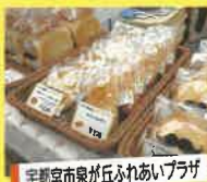
宇都宮市泉が丘ふれあいプラザ