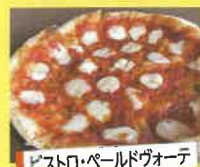
ヒストロ・パールドヴォーテ