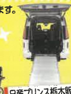
日産プリンス栃木販売