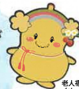
栃木県 老人福祉施設協議会 イメージキャラクター とちふくちゃん

とちまるくんと とちふくちゃんが あそびにくるよ！ ウズまごダンスを いっしょにおどろう