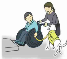
乗り越えられない段差の介助