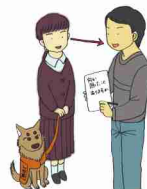
館内放送や電車内のアナウンスの伝達