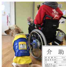
(左) 介助犬とユーザー (右) 介助犬の表示