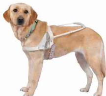
ハーネスを着けた盲導犬