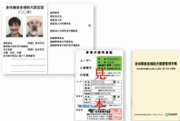
(左上) 身体障害者補助犬認定証 (下左) 盲導犬使用者証 (下右) 身体障害者補助犬健康管理手帳