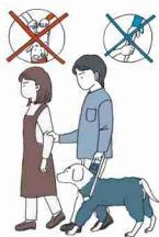
不慣れた場所への誘導

お困りの様子が見られたらユーザー本人に「何かお手伝いしましょうか」「どのようにお手伝いすればよろしいですか」などの声かけや筆談でコミュニケーションをとりましょう。