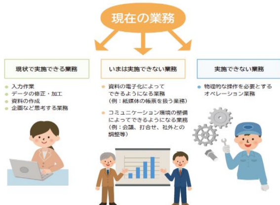
■ 図表Ⅱ-4-1 対象業務の整理